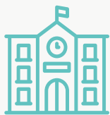
Escolas e Universidades