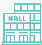
Centros comerciais, Lojas e Mercados