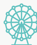
Esporte, Lazer e Entretenimento